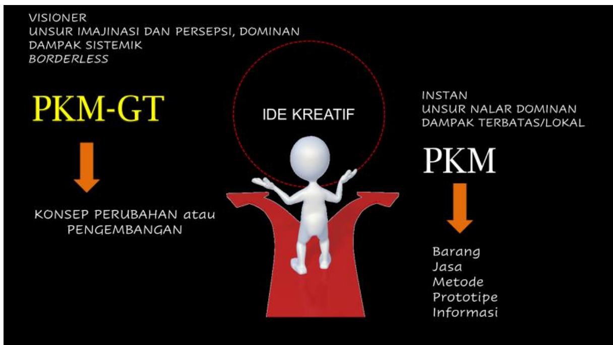
Gambar 1. Perbedaan PKM-GT dan PKM lainnya

Untuk memenuhi kriteria problem solving , maka PKM-GT juga memerlukan identifikasi persoalan yang bisa dihadapi masyarakat di berbagai strata, misalnya mengatasi dampak bencana erupsi vulkanik atau bahkan persoalan bangsa, misalnya pendidikan untuk para